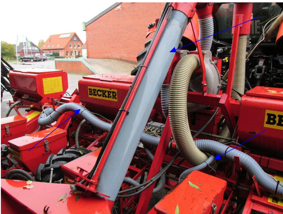
Bild 8: Stahlschneckenrohr durch Kunststoffrohr ersetzt. Schläuche teilw. erneuert