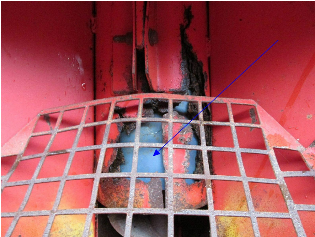
Bild 9: Schneckenrohr im Trichter durchgerostet, durch Kunststoffrohr ersetzt.